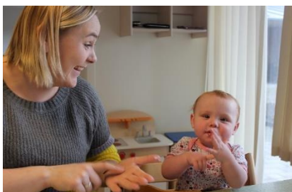
Arbejdet med Baby tegn

En gruppe med små børn har arbejdet med babytegn og sang og musik – de har lavet billedkort til forældrene til information og inspiration = rød tråd hjemme og dagpleje.